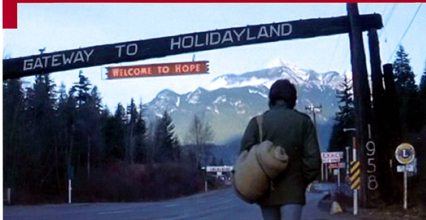
Une scène du film Rambo , film hollywoodien de 1988. Le roman de David Morrell, First Blood est paru en 1972 et présente les difficultés rencontrées par les vétérans de la guerre du Vietnam une fois de retour au pays.